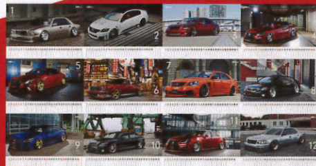
VIPSTYLE ORIGINAL CALENDAR 2018