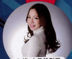
セダン女子特別編

VIP SEDANS ARE A CATEGORY OF HIGH-CLASS CUSTOMIZED CARS. "VIP STYLE" HAS BEEN ISSUED AS A MONTHLY MAGAZINE FOR PEOPLE WHO ARE INTO THE CATEGORY. WE WILL PICK UP STYLOR SEDANS EQUIPPED WITH AERO-ACTS FROM ALL OVER JAPAN, AND IT WILL BE A MAGAZINE ACTIVELY INVOLVING CAR OWNERS INTO THE MAKING OF IT.