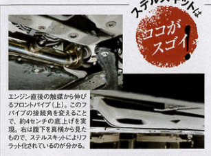
エンジン直後の触媒から伸びるフロントパイプ(上)。このパイプの排気角を定めることで、約4センチの底上げを実現。右は腹下を真横から見たもので、ステルスキットによるフラット化されているのが分かる。