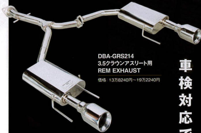
DBA-GRS214 3.5クラウンアスリート用 REM EXHAUST 価格 13万8240円~19万2240円

左の写真が純正の分岐部分で、右がレムエキゾーストのもの。ロアアームの支持部との距離を比較すれば、レムエキゾーストが相当に腹下に近いことが分かる。