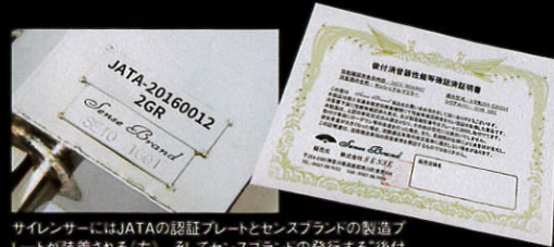
サイレンサーにはJATAの認証プレートとセンスブランドの製造プレートが装着される(左)。そしてセンスブランドの発行する「後付消音器性能等確認済証明書」も付属。どれも車検対応の証。

かつて社外マフラーと言えば、近接排気騒音、さえクリアしていれば車検に通った。しかし、平成22年の4月以降に製造されたクルマにはそれにプラスして、加速排気騒音、という検査もクリアしなければならぬ。という規制が新たに課せられるようになった。この二つの検査をクリアした社外マフラーの証明として、国が定めた検査機関である、JATAなどの認証プレートが必要に。例えば純正並の音量であったとしても、認証プレートがなければ車検でNGになるのが、現在の社外マフラー事情なのである。