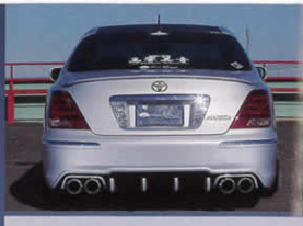
リアビューはシャープな縦フィンで、疾走感とスポーティ感を強調。