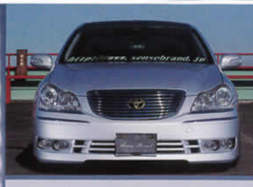
横に大きく幅を持たせた台形開口部が、ドッシリとした空気感を実現。

美しい高音にこだわったかつてない交換型マフラー・高響美音 マエストロサウンド 奏に続き、200クラウン用エアロまでもリリースしたセンスブランド。さらに、今月号では最新エアロとなる18マジェスタ用センセーションがデビューを遂げた。