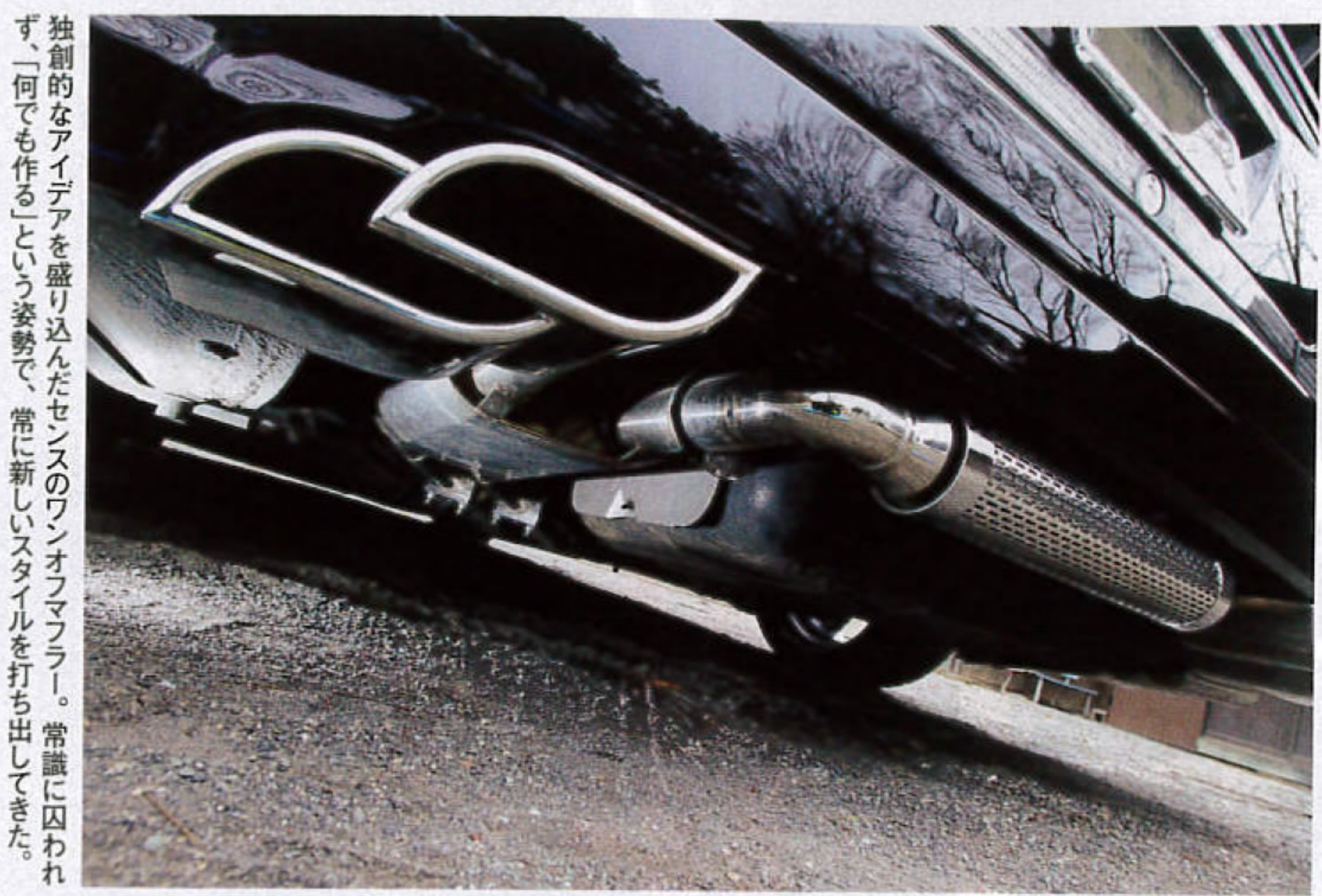
独自のアイデアを盛り込んだセンスのワンオフマフラー。常に囚われず「何でも作る」という姿勢で、常に新しいスタイルを打ち出してきた。

創立10周年を迎えるセンスブランドだが、特にここ数年の躍進ぶりには目を瞠めるものがある。意欲的にリリースされるテールエンド、ステルスキットの開発、エアロ業界への進出……。そんな「元気なセンス」の原動力とは。