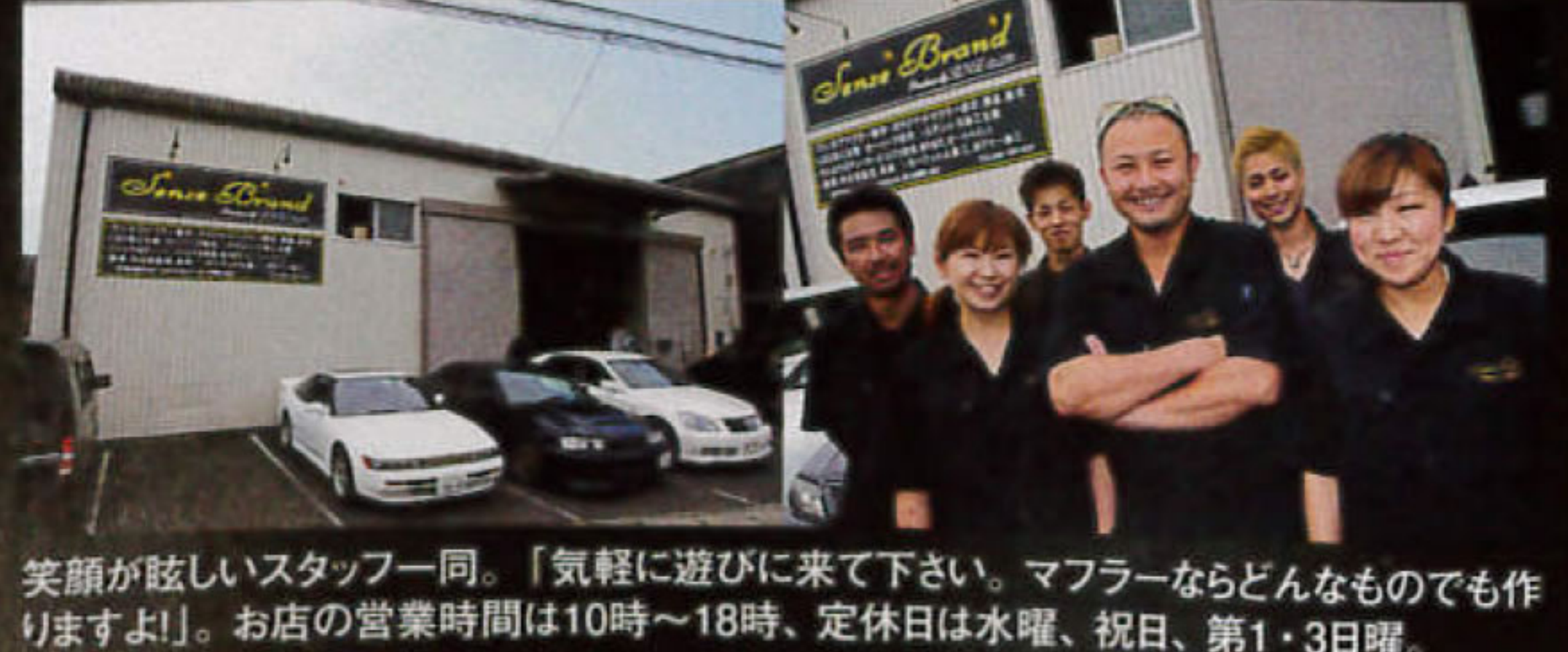
笑顔が眩しいスタッフ一同。「気軽に遊びに来て下さい。マフラーならどんなものでも作りますよ!」。お店の営業時間は10時~18時、定休日は水曜、祝日、第1・3日曜。

■神奈川県老名市本郷2680-3 ■tel.046-239-0117 ■http://www.sensebrand.jp