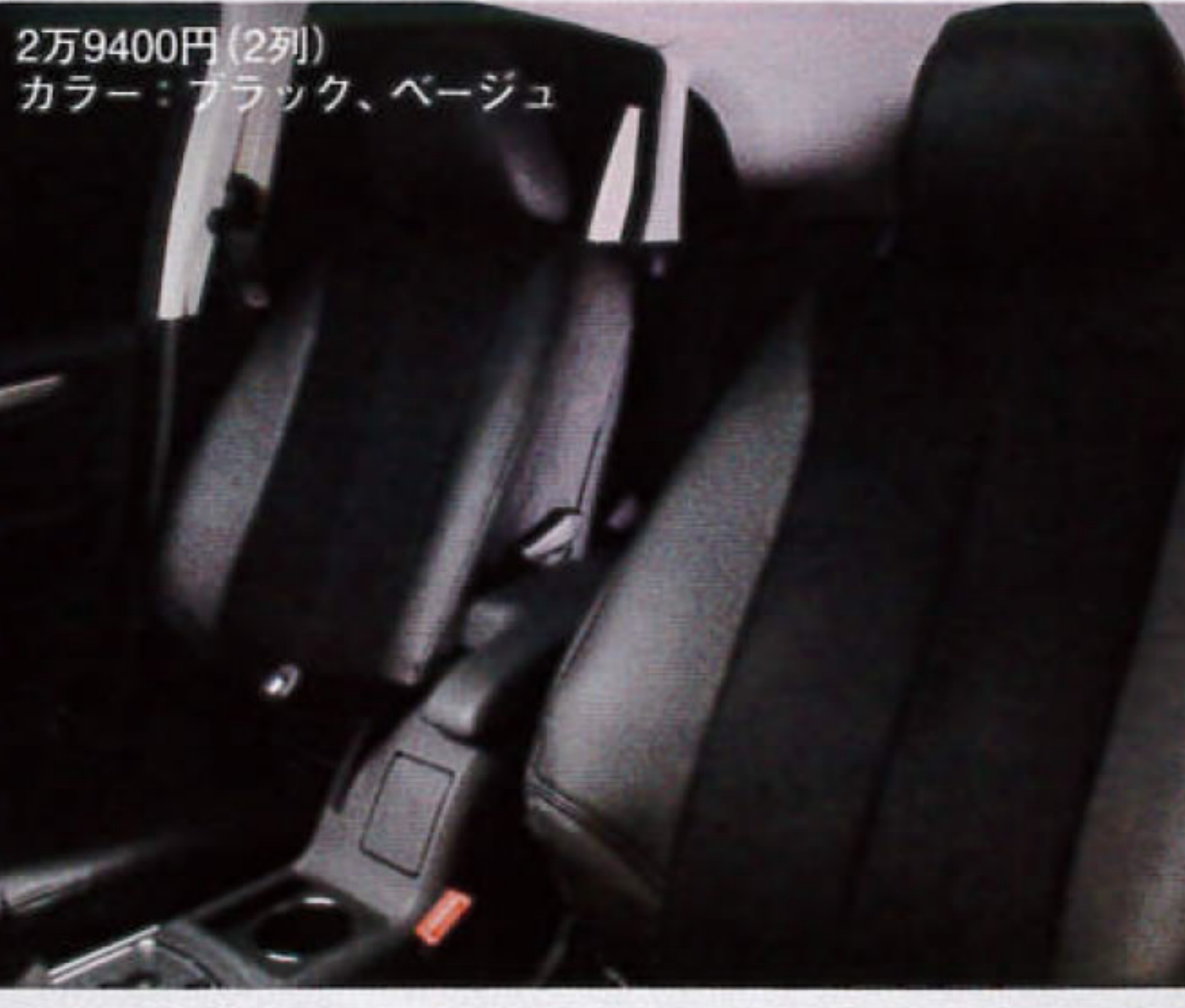
2万9400円(2列) カラー:ブラック、ベージュ

あえて純正風のシンプルさを追求 蒸れずに快適な座り心地を提供する 弾力性が高く、摩擦に強いヌプリノー生地を採用したシートカバー。センター部はメッシュ処理を施しているため通気性に優れ、四季を通じて快適に座れる。シートパターンはシンプルな純正風がこだわり。