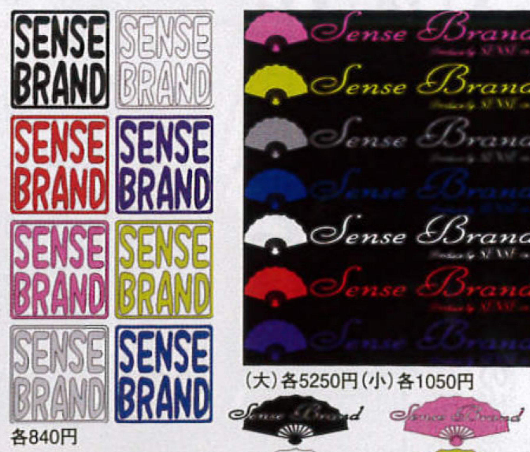
(大)各5250円(小)各1050円 各840円 各1050円

キラキラ光るラメ入り素材が魅力の 遊び心溢れる切り文字ステッカー 可愛いハコ風のデザインや、ロゴマークの扇子を生かした切り文字タイプのステッカー。すべてラメ入りで、光が当たるとキラキラ輝くのが特徴。カラーはブラック・ホワイト・レッドなど全8色をラインナップしている。