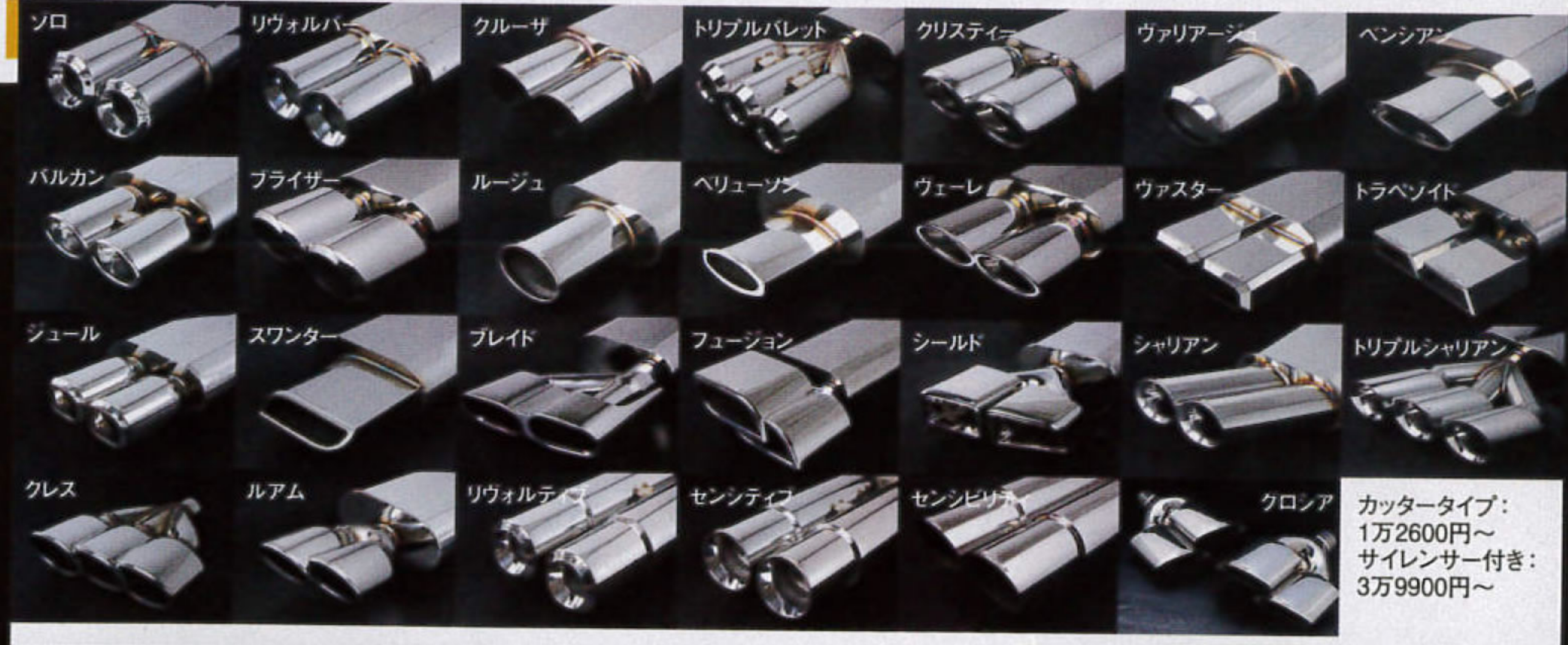
カッタータイプ: 1万2600円~ サイレンサー付き: 3万9900円~

「センスのいいものを作るブランド」という意図の直球のネーミング。バックの扇子はもちろん「センス」と「扇子」をかけたシャレ。「和風な感じが良かったのと、扇子の広がりのように会社発展を、という願いも込められています。ちなみに元々は「センス」だったが、汎用品の発売を機に「ブランド」が追加された。