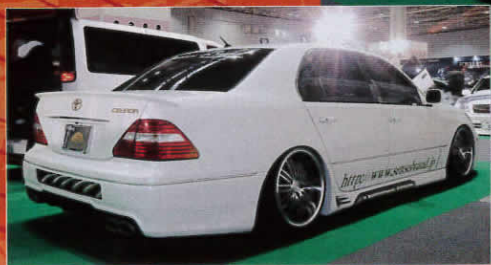
リアのアンダー部には4本のフィンを加える。マフラーメーカーだけに、サイド管やリアのスパイラル管など、特長的なマフラーメイトを演出。